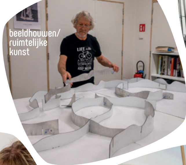
beeldhouwen/ ruimtelijke kunst