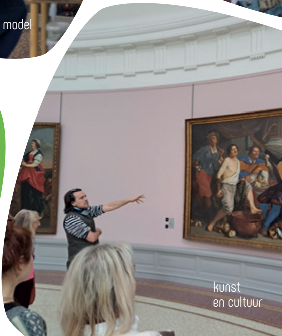
kunst en cultuur